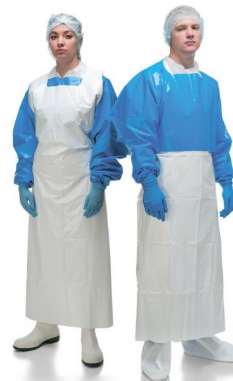
Способ использования 1

Комбинируется с классическим фартуком. Может применяться поверх основного фартука или под него.